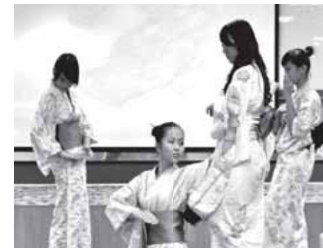
Điệu múa Gheisa của sinh viên FPT

Sinh viên FPT cùng các bạn sinh viên đến từ VJCC đã mang đến cho người xem màu sắc Nhật Bản qua các tiết mục văn nghệ đặc sắc trong trang phục truyền thống Nhật Bản. Đồng thời, trong khuôn viên Trường ĐH FPT còn có các gian hàng của sinh viên đến từ Trường ĐH FPT, ĐH Ngoại thương, ĐH Thăng Long, ĐH Phương Đông. Trước đó, từ ngày 09/11 đến ngày 14/11/2009, nhiều bộ phim Nhật đã lần lượt được trình chiếu các ngày trong tuần tại Trường ĐH FPT. Đặc biệt tại Lễ hội, GS. Hideo Kuroda - Giảng viên Trường ĐH FPT - Phó Hội trưởng Hiệp hội trà đạo phái Omotesenke Tỉnh