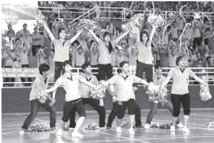
Màn đồng diễn ấn tượng của sinh viên FU HCM

với sinh viên và giữa các sinh viên sẽ càng thêm bền chặt. Hoạt động này được FE HCM tổ chức thường niên nhằm tôn vinh những giảng viên, cán bộ nhân viên đang tham gia sự nghiệp “trồng người”.