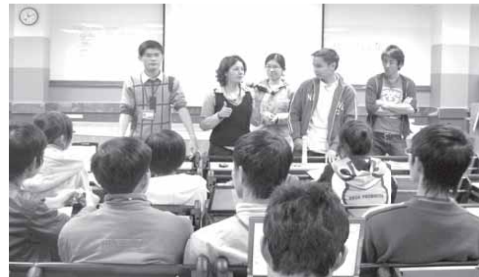
Tình nguyện viên Thụy Sĩ đang hướng dẫn sinh viên cách sử dụng bao cao su

Không chỉ thông qua các slide trình chiếu, các trò chơi, sinh viên đã trực tiếp tham gia đóng kịch và lên thực hành sử dụng bao cao su trên mô hình. Qua các buổi Workshop cho thấy, sinh viên FPT đã nhanh chóng vượt qua sự ngượng ngùng ban đầu, tham gia một cách hứng thú cũng như nhận thấy tầm quan trọng của việc hiểu biết về vấn đề này. Đây còn là một cơ hội tốt để sinh viên tăng khả năng giao tiếp tiếng Anh với người nước ngoài.