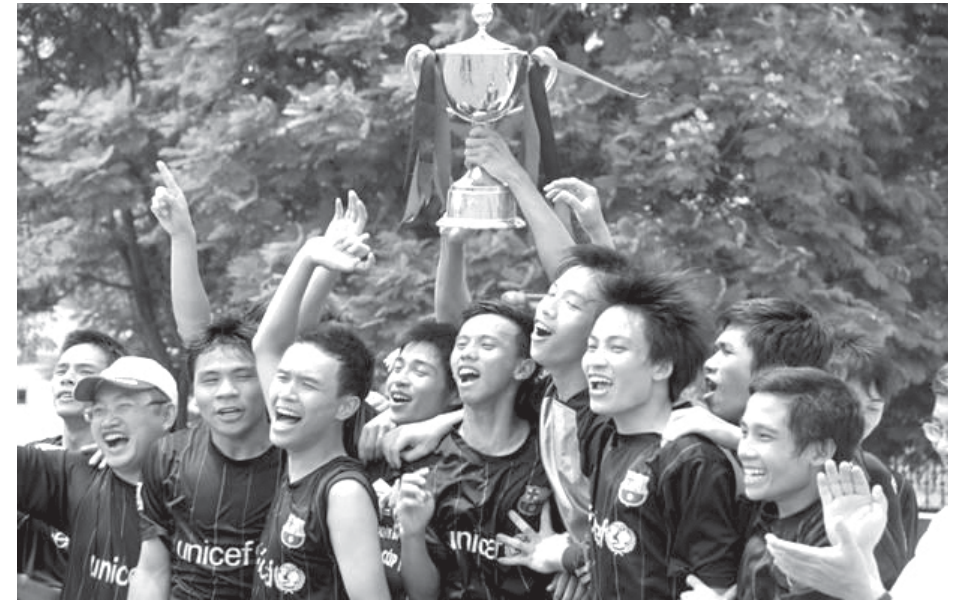
Đội tuyển Trường ĐH FPT vô địch Cup FPT 13-09-2009

Cuối tháng 11, "Giải bóng đá sinh viên FPT" do các thành viên CLB Bóng đá tổ chức sẽ chính thức khai mạc. Đây là một giải đấu được Trường ĐH FPT tổ chức thường niên, dự kiến năm nay có 30 đội tham gia tranh giải.