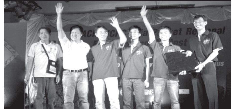
Đội FU Toad đại diện Trường ĐH FPT lên nhận giải

Ngày 04/11/2009, cả ba đội tuyển Trường ĐH FPT gồm FU Toad, Blue Flame, Jose Mourinho đều lọt vào danh sách Top 25 đội được vinh danh tại Lễ trao giải vòng loại ACM/ICPC Khu vực Châu Á – Phuket Thái Lan. Kết quả này đã góp phần không nhỏ tạo nên thành công của đội tuyển Việt Nam.